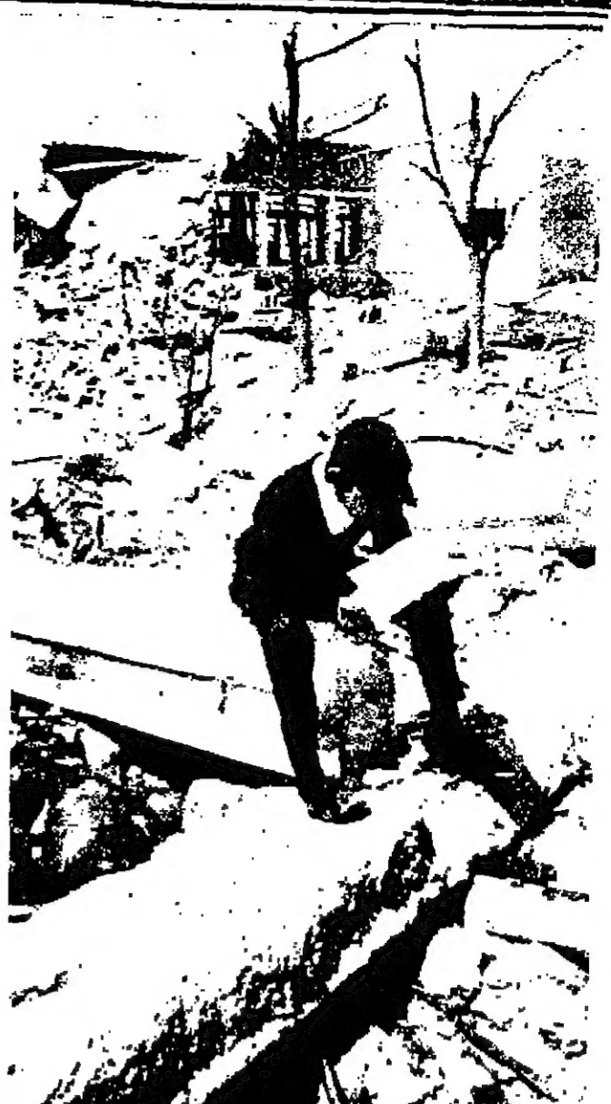
الجم والبناء على ارض واحدة... قد حذر الاسرائيليون بمخاوفهم على الكرامة عندما من منزل السكان الذين ولكن الشعب الاردني الواعي اليقظ لا كان لديه للجمود - وهذا القوي القوي يبرز الى المستقبل اليقظ في الاردن

باريس - رويتر - قال طبيب فرنسي ان حوالي نصف مرضى مترويات باريس من الممنين على المترويات المرحمة